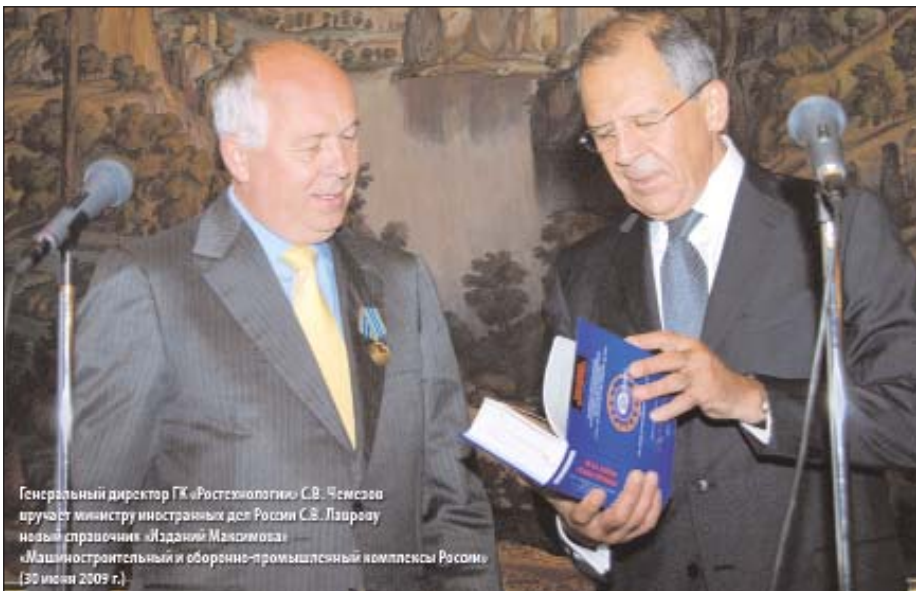
Генеральный директор ГК «Ростехнологии» С.В. Чемезов вручает министру иностранных дел России С.В. Лаврову новый справочник «Издания Максимова» «Машиностроительный и оборонно-промышленный комплекс России» (30 июля 2009 г.).

— На 100% мы зависим от Вашего доверия и готовности к сотрудничеству. Ведь основа успеха нашего бизнеса — это информация, и для нас принципиально важно получать ее из первоисточников. Мы признательны «Аэрокосмическому курьеру» за предоставленную возможность рассказать о наших справочниках и разместить на сайте журнала ( www.ascourier.ru ) анкету для тех компаний и предприятий отрасли, которые пока не вошли в нашу базу данных. Анкету можно заполнить на экране в интерактивном режиме на http://www.maximov.com/anketa , или http://www.ascourier.ru/news/ . Теперь только от Вас зависит, как будет выглядеть Ваш бизнес на визитной карточке России. □